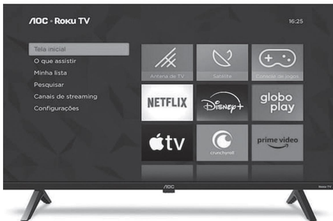
Smart TV AOC 43" Full HD DLED 43S5045/78G Roku TV Processador Quad Core Dolby Áudio Preta