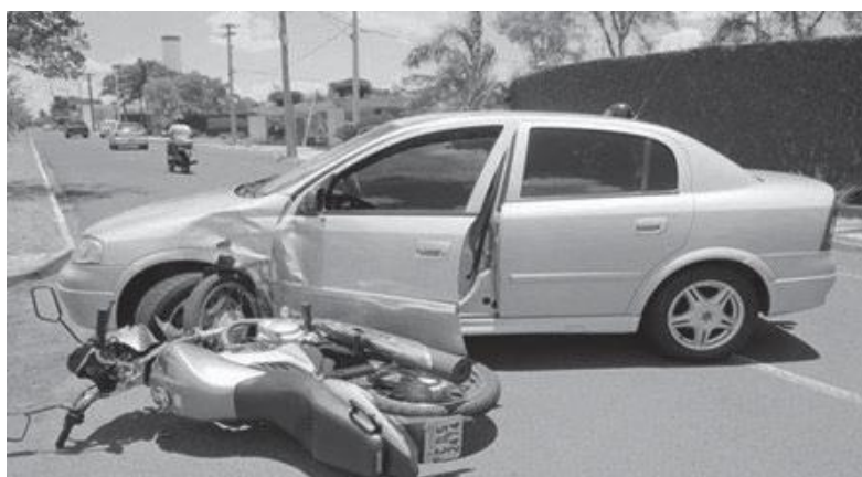
Imagem apenas ilustrativa